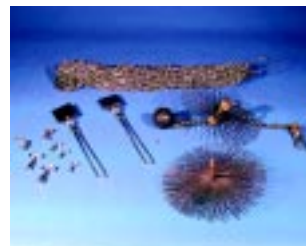
Bild 5: Schornstein-Werkzeugsatz (Beispiel aus der Beladung LF 16)

Den Kaminbrand selbst grundsätzlich nicht mit Löschmitteln bekämpfen